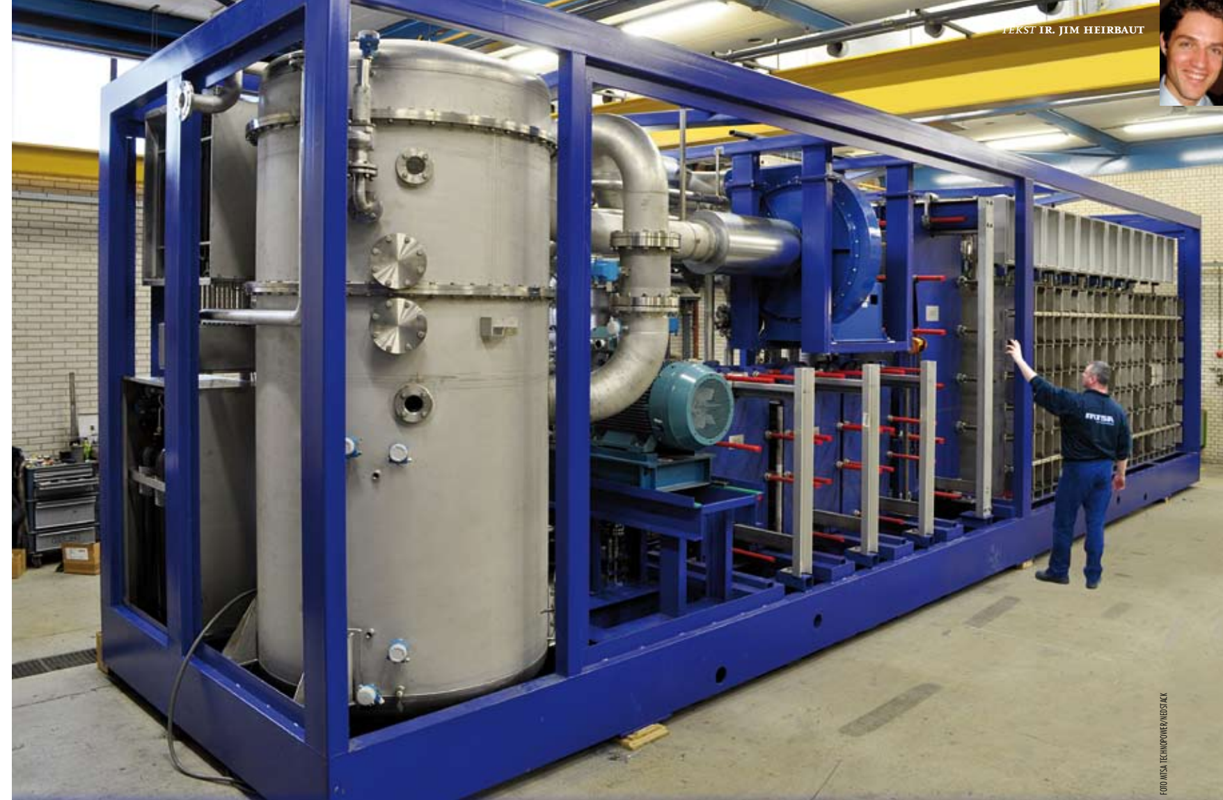
De PEM Power Plant, met links het vat waarin de lucht wordt bevochtigd en rechts de open wand waarin de stacks komen.

De keuze voor het vermogen van 1 MW hangt onder meer samen met de ideale grootte van de benodigde infrastructuur. De centrale heeft met een lengte van 13 m grofweg de